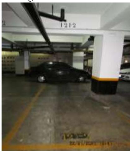
Garagem da unidade avalianda