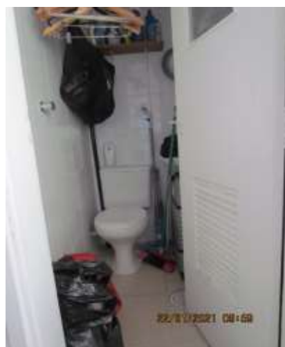
WC na área de serviço