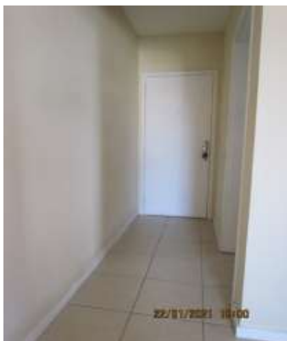
Corredor de entrada