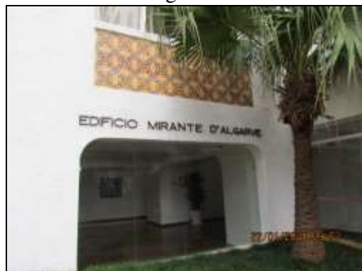
Ed. Mirante D'Algarve – local da unidade avalianda