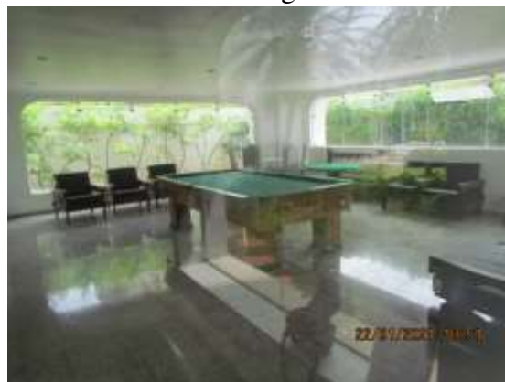
Salão de Jogos