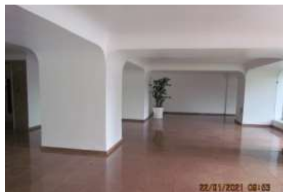
saguão de entrada