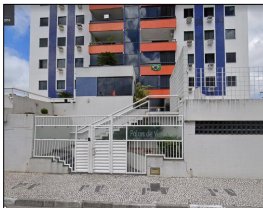
(Fachada do imóvel)