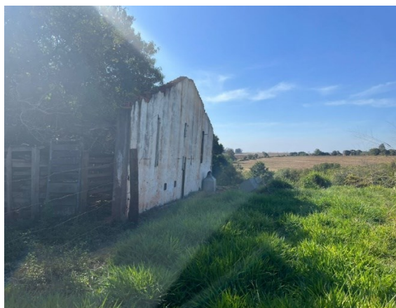
Fundos do imóvel