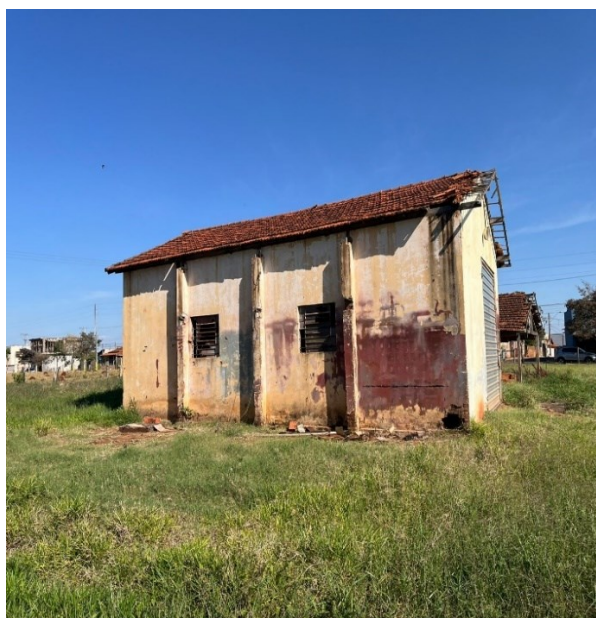
Galpão em Alvenaria