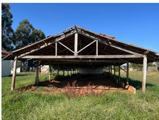
Galpão sem paredes