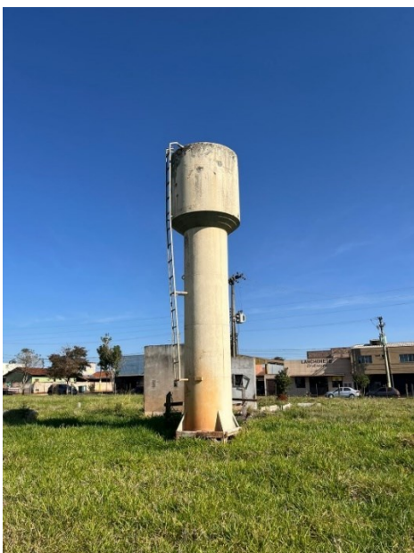
Torre de Água