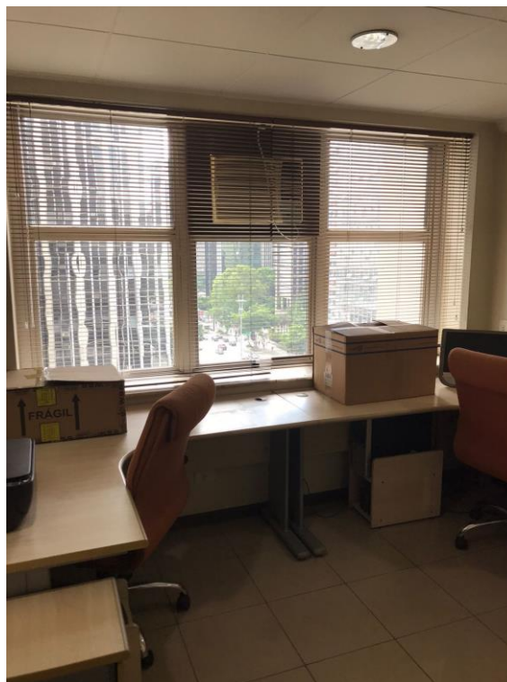
Vista da sala 2 para a Avenida Paulista